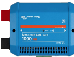
Lynx Smart BMS NG 1000 A